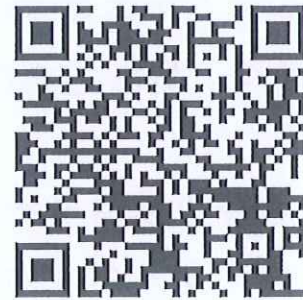
資格與展延申請表單