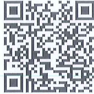
「居家藥事照護」 藥師資格申請及展延辦法