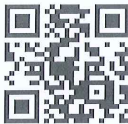
計畫專屬網頁連結